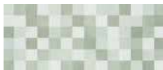
25x60 Paper Mosaico Salvia € 29,90 mq ■ 9