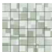
30x30 Paper Mosaico SU RETE Salvia € 14,00 pz □ 11