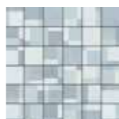
30x30 Paper Mosaico SU RETE Avio € 14,00 pz □ 11