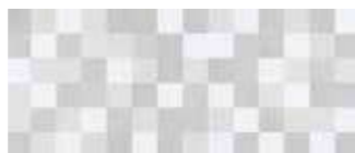
25x60 Paper Mosaico Grigio € 29,90 mq ■ 9