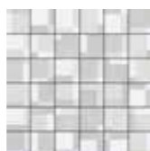
30x30 Paper Mosaico SU RETE Grigio € 14,00 pz □ 11