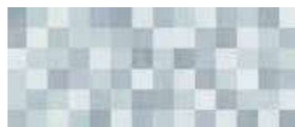
25x60 Paper Mosaico Avio € 29,90 mq ■ 9